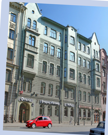
Stony Island ***+

Matkalle tarvitaan mukaan passi, jonka tulee olla voimassa 6 kk matkan jälkeen. Passin tiedot tarvitaan etukäteen toimistoomme.