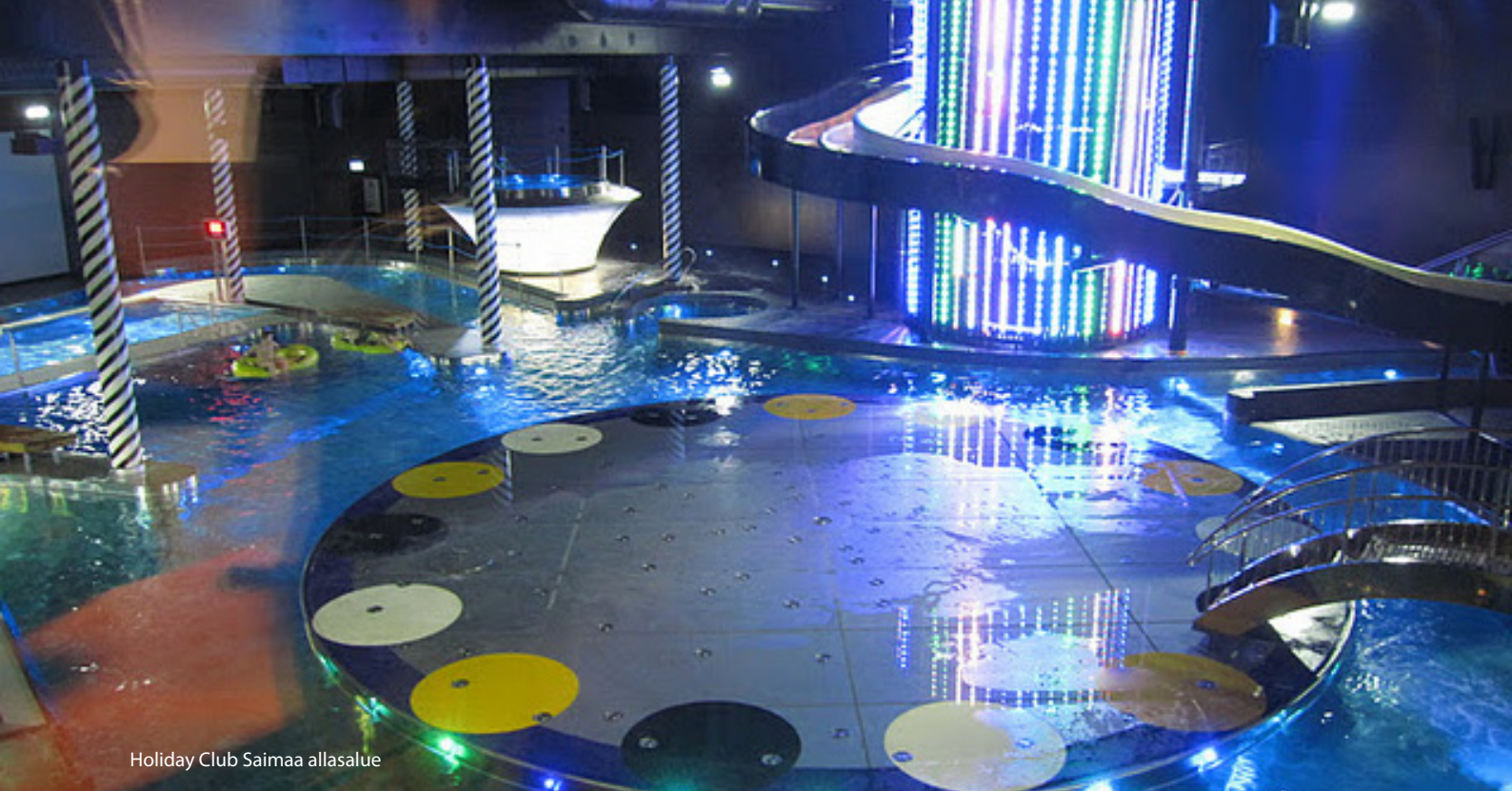
Holiday Club Saimaa allasalue